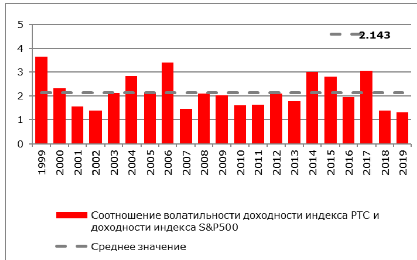
Рисунок 1. Соотношение стандартного отклонения доходности индекса PTC и стандартного отклонения доходности индекса S&P500