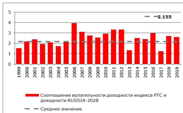
Рисунок 2. Соотношение стандартного отклонения доходности индекса PTC и стандартного отклонения доходности RUSSIA-2028